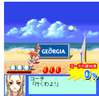
ビーチバレーガールしずく